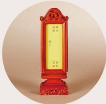
感恩功德超薦牌位