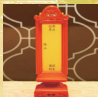
感恩功德超薦牌位