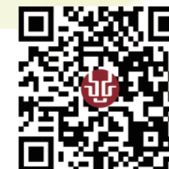
一指完成祭品訂購