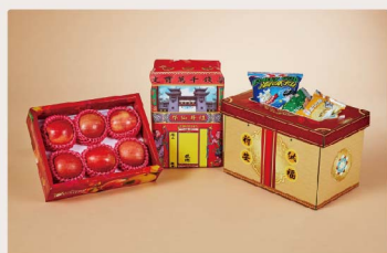
如意型祭品組(乾料)