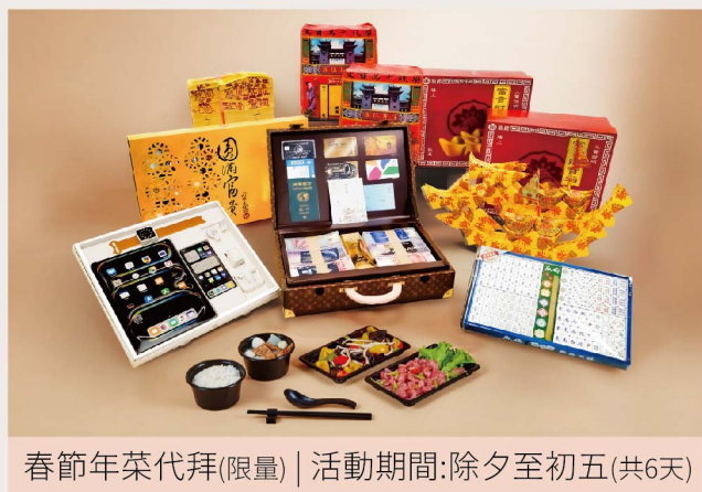
春節年菜代拜(限量) | 活動期間:除夕至初五(共6天)