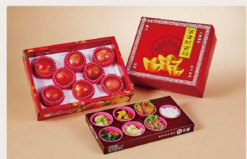
感恩型祭品組(菜飯)

凡訂購法會祭品，龍巖嘉雲生命紀念館將統一代拜。祭品組合內容若有些微調整，依現場擺設為主。