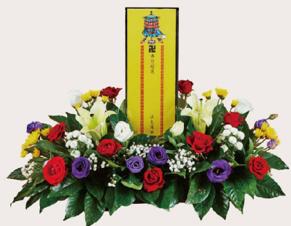
限量|富貴超薦 (依當季花材設計，以現場擺設為主)