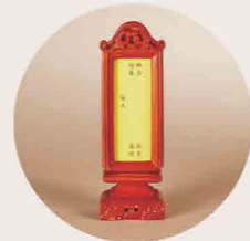
感恩功德超薦牌位