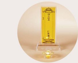
佛前主壇點燈超薦牌位