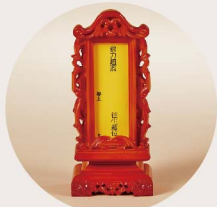
感恩功德超薦牌位