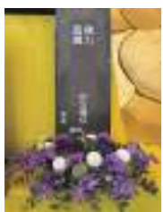
佛前供花超薦牌位